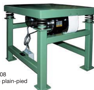
VT 7/8 avec 2 NEG 50770 electrique