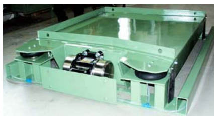
VTHW 12/12 avec 2 NEG 501510 pour une balance

NetterVibration propose les accessoires nécessaires pour le montage, l'installation, la commande et la surveillance de vibrateurs et de perceurs.