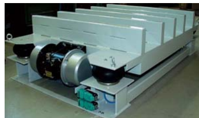
VTF/R 10/12 avec 2 NEG 251370 E pour utilisation conforme à ATEX