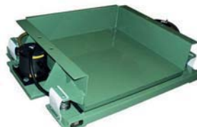
VTF 8/8 avec 2 NTS 50/08 construction de plain-pied