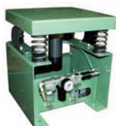
VTP 3/3 avec NTS 350 NF pneumatique