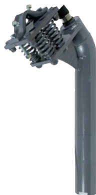
NCX M gebogen