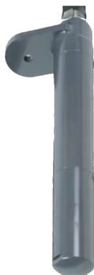
NCX M gerade