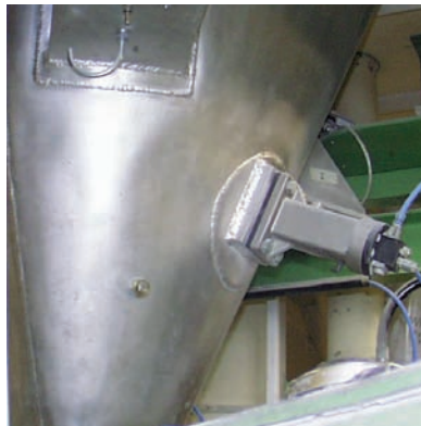
Abreinigen von Bunkerwänden