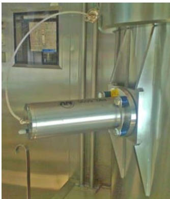
Abreinigen von Rohren

Sobald der VAC-Halterung Druckluft zugeführt wird, saugt sich die Einheit fest und sichert so eine kraftschlüssige Verbindung zwischen dem Klopper und dem Untergrund. ATEX konforme Halterungen und Geräte mit Edelstahlplatte sind lieferbar.