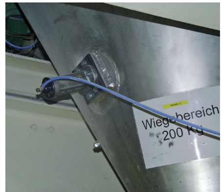
Abreinigen von Wiegebehältern