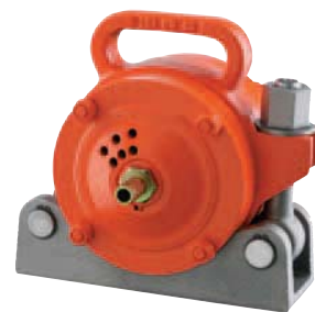
NVT 87 mit Halterung NVH 4