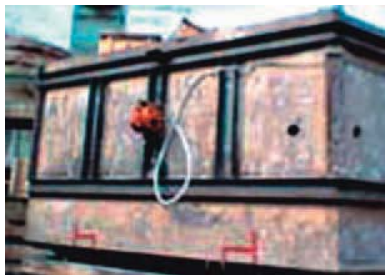
Verdichten von Formsand

Halterungen zu diesen Vibratoren finden Sie auf unserem Datenblatt.