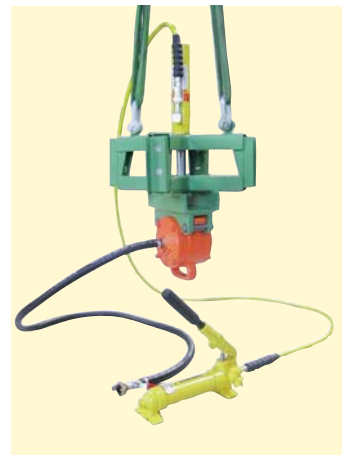
Croix avec cylindre hydraulique