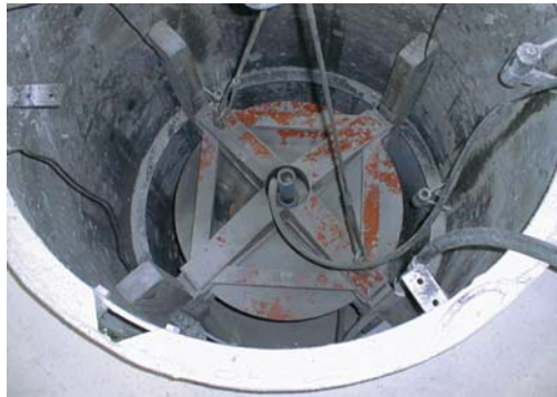
Positionnement de la croix dans le four