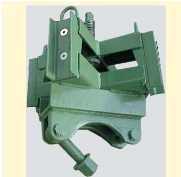
Croix avec réglage par broche