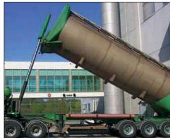
Entleeren von Silofahrzeugen