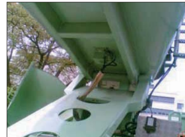
NHG 900 L