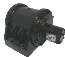
NHG 6000 L