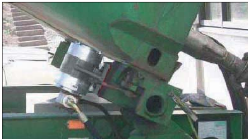
NHG 3000 L