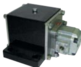
NHG 500 L