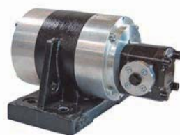
NHG 3000 L