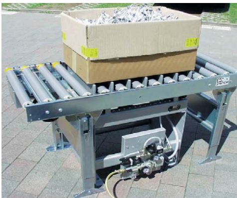
Compactage/aplanissement de matériaux au sein de la chaîne de production à l'aide d'une table vibrante