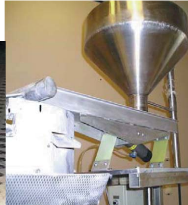
Transport et dosage précis de matières en vrac par convoyeurs