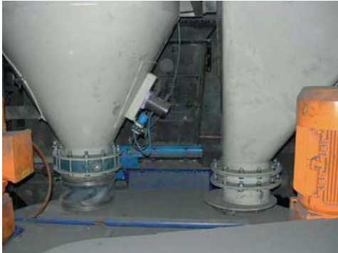
Décollement d'incrustations tenaces à l'aide de vibrateurs pneumatiques à piston