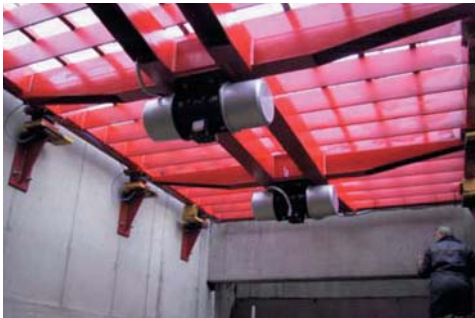
Tamisage de matières en vrac à gros grains au moyen de vibrateurs électriques externes