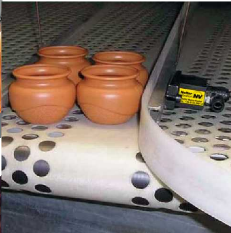
Prévention des engorgements au moyen de vibrateurs pneumatiques circulaires