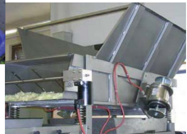
Transport au moyen de vibrateurs électriques externes en inox