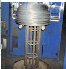
Desserrage et détente de bobines de fil de fer à l'aide de vibrateurs électriques externes