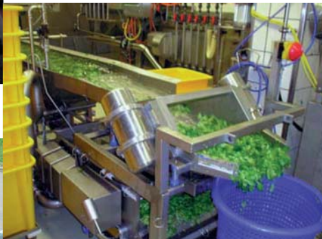
Convoyeur de criblage vibrant entraîné par des vibrateurs électriques externes en inox