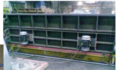
Verdichtung von Beton an einer Stahlschalung mit Elektro-Außenvibratoren Serie NEG