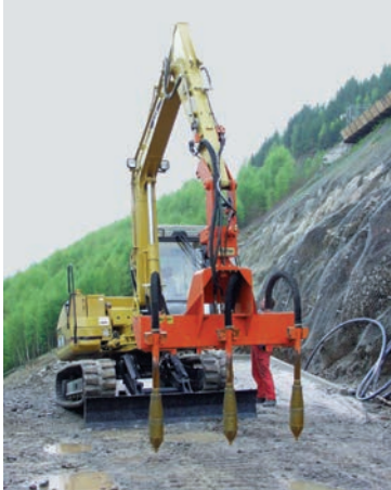
Bagger bestückt mit Hydraulik-Innenvibratoren Serie NHR zur Verdichtung von Massenbeton