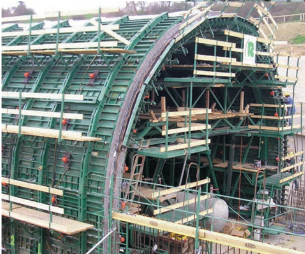
Tunnelschalung mit Druckluft-Außenvibratoren Serie NVT