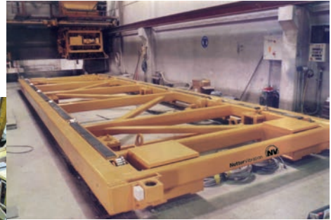
Geräuschlose Verdichtung von Fertigteilen mit dem Vibrationstisch Serie GyroShake