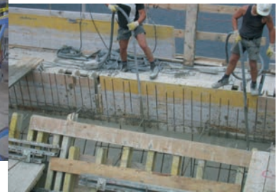
Betonverdichtung im Hochbau mit Elektro-Innenvibratoren Serie NCZ